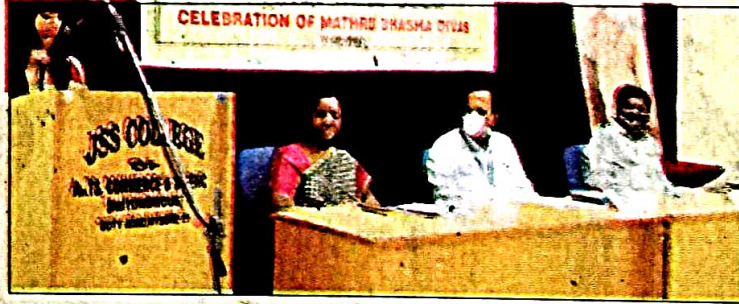
ನಗರದ ಊಟ ರಸ್ತೆಯಲ್ಲಿರುವ ಜೆಎಸ್‌ಎಸ್ ಕಲಾ, ವಾಣಿಜ್ಯ ಮತ್ತು ವಿಜ್ಞಾನ ಕಾಲೇಜಿನಲ್ಲಿ ಮಾತೃಭಾಷಾ ದಿನಾಚರಣೆ ಕಾರ್ಯಕ್ರಮ ನಡೆಯಿತು.